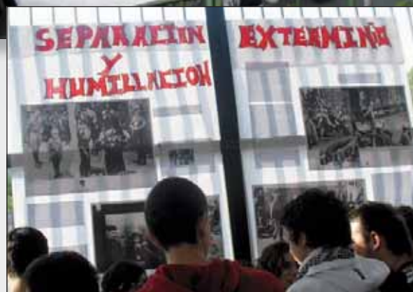
Alumnos y alumnas contemplando los murales expuestos con motivo del día del Holocausto.