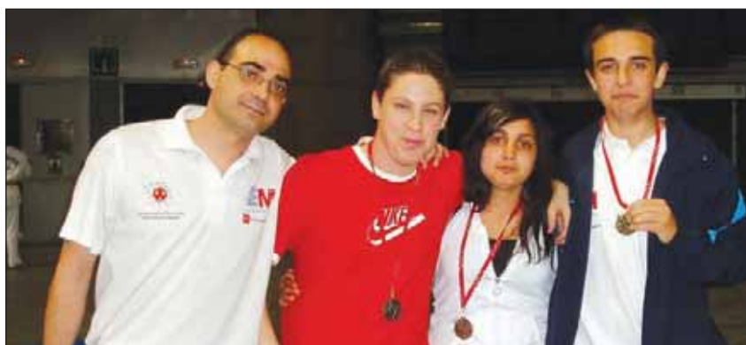
Alumnos de Judo en la recogida de las medallas.