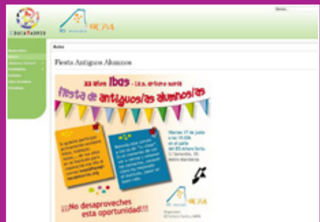
A la izquierda, página web del instituto y a la derecha pagina web del AMPA.