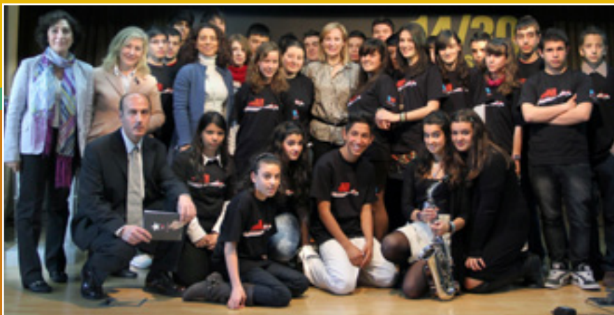
Alumnos y profesores del IES junto a la viceconsejera de cultura.

El acto terminó con la foto de protocolo y una visita por la Exposición temporal que teníamos en el centro con motivo de la Semana Francesa.