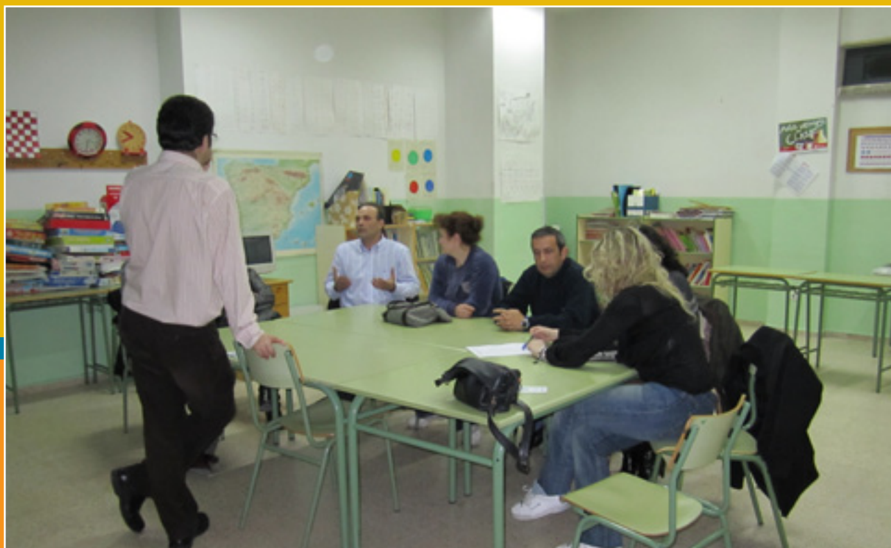
Sesión del Taller de la Escuela de Padres.

El taller fue realizado por profesionales de Summa Madrid, fue dinámico y constructivo y por ello animo a todos los padres a que participen en futuros talleres.