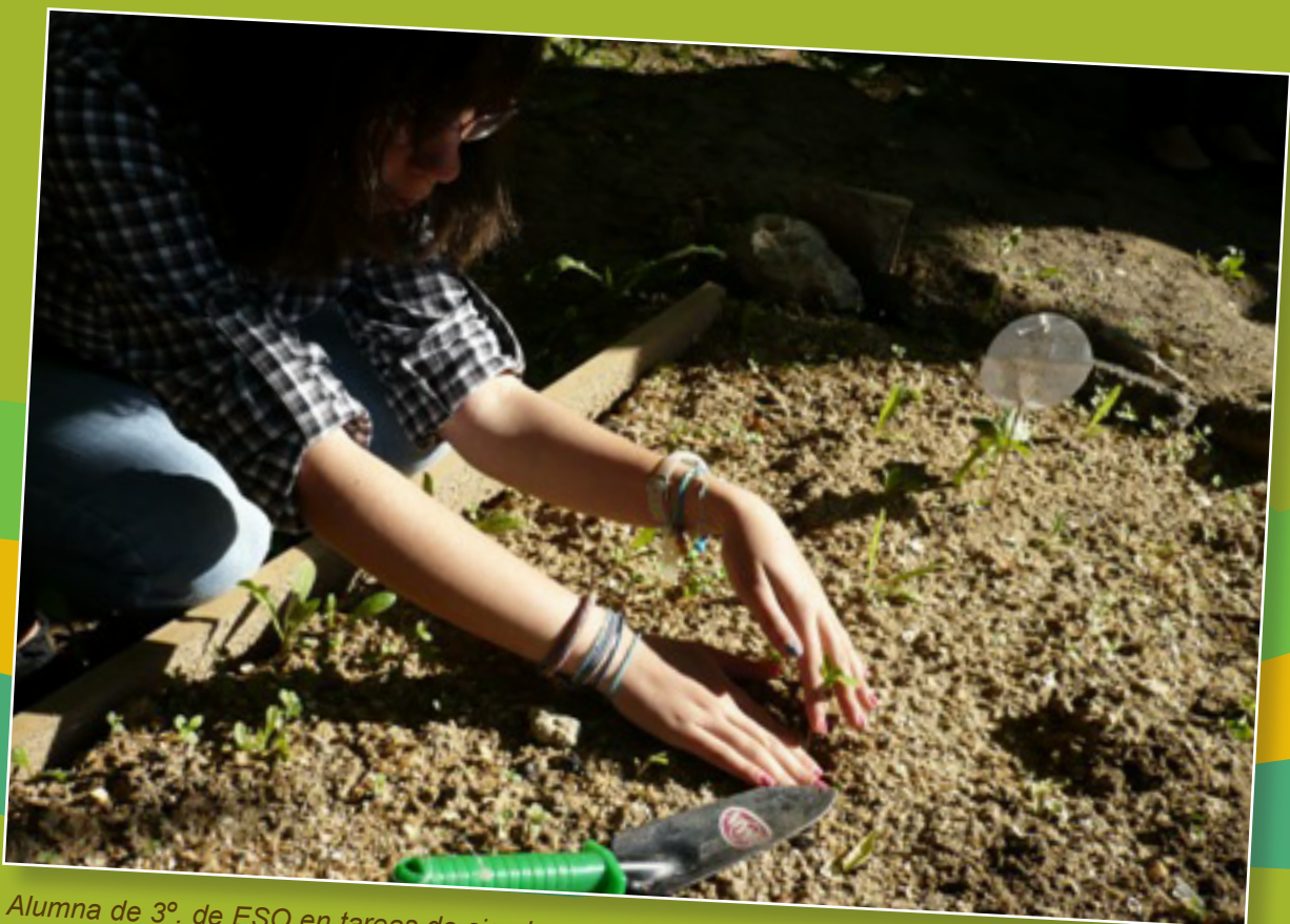
Alumna de 3º. de ESO en tareas de siembra.

Lo mejor del proyecto ha sido la motivación, participación y aportación de ideas del alumnado.