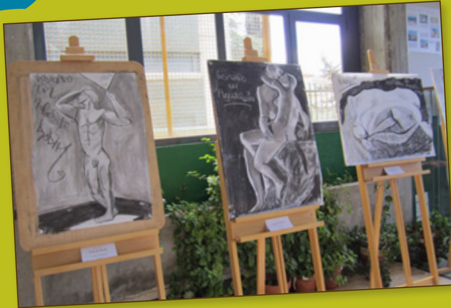
Reproducción de alumnos del IES de distintas obras de Rodín.