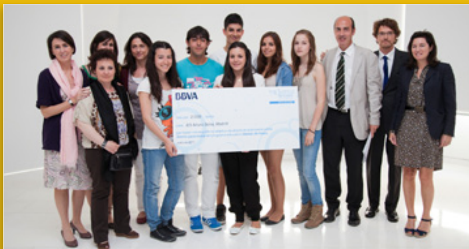
Entrega del cheque del BBVA al IES.