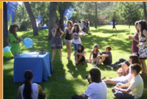
Experiencias educativas del Canal de Isabel II

Estos trabajos de redacción pueden leerse en el siguiente enlace: http://www.canaleduca.com/Programas-educativos/Cara-a-Cara