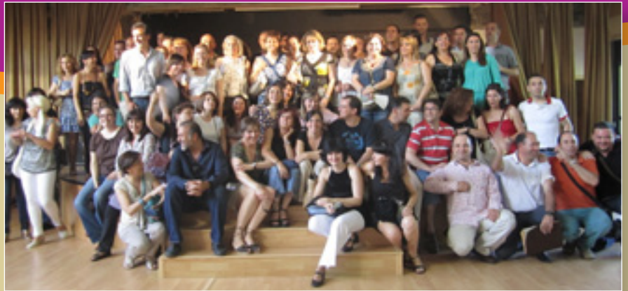
Antiguos alumnos y alumnas del IES.

Hubo un grupo de música, pinchos, refrescos y, sobre todo, alegría por el reencuentro.