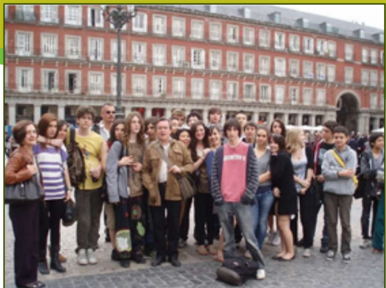
Visita a la Plaza Mayor.