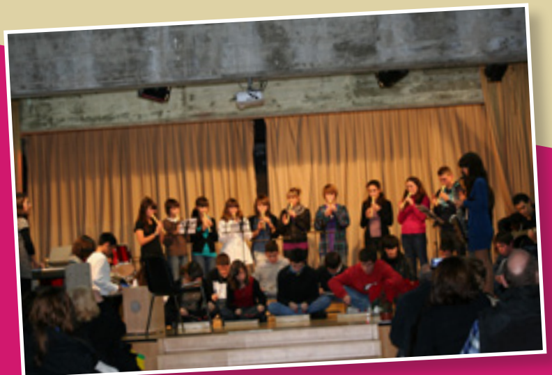
Actuación musical de 3º. ESO.