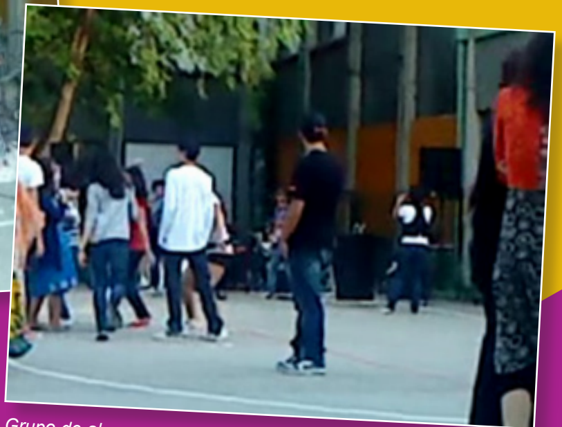
Grupo de alumnos.